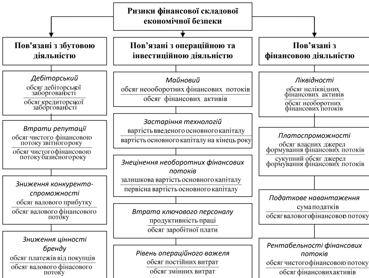
Рис. 2. Методика оцінки ризиків підприємницької діяльності

категорії та зайняло провідне місце в сучасних економічних дослідженнях як на державному, регіональному рівнях, так і на рівні підприємств агропродовольчої галузі [4].