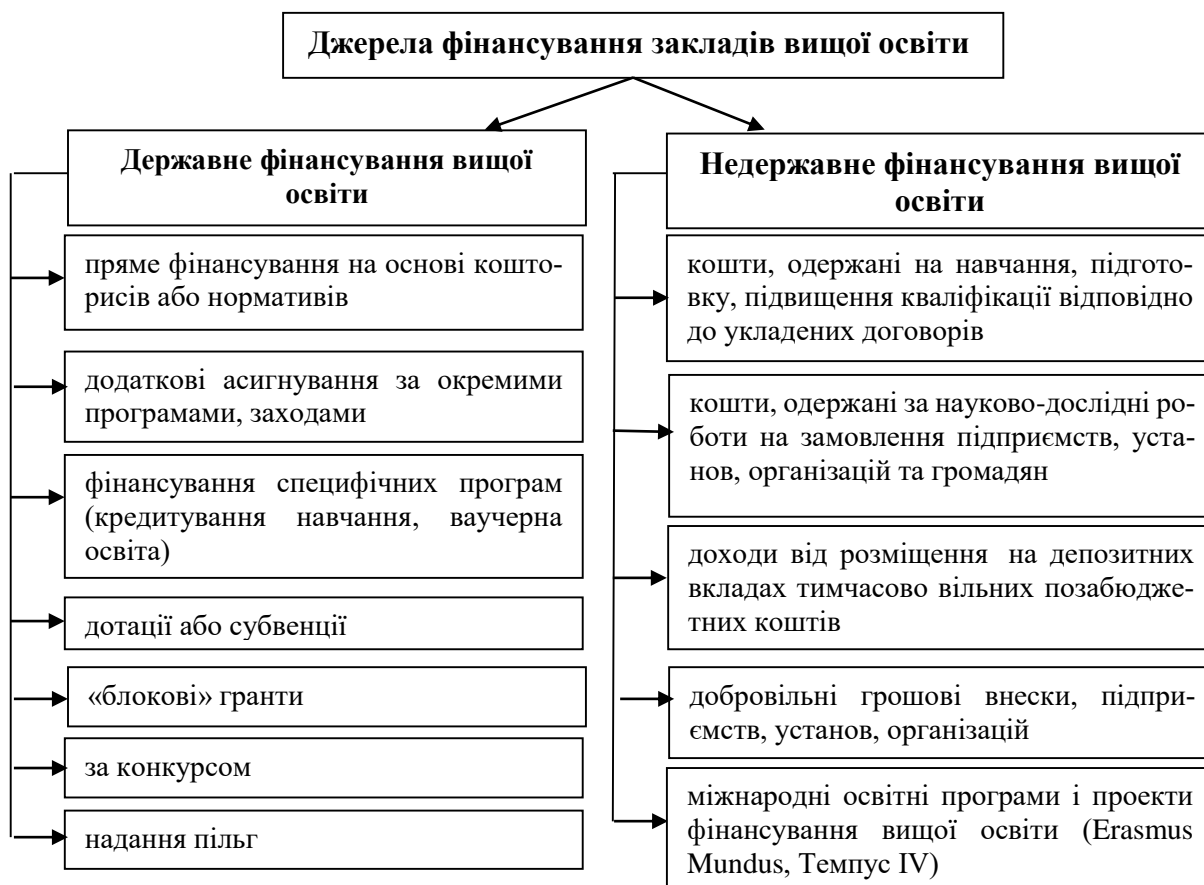
Рис. 1. Джерела фінансування закладів вищої освіти

Джерела фінансування закладів вищої освіти показано на рис. 2.