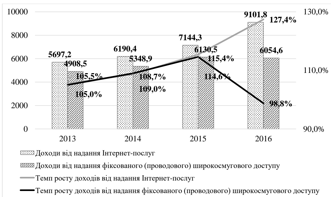
Рис. 3. Динаміка доходів від надання послуг доступу до мережі Інтернет та ШСД у 2013-2016 рр., млн грн*

Обсяги доходів від надання послуг фіксованого (проводового) широкосмугового доступу (ШСД) до мережі Інтернет у 2016 році в порівнянні з аналогічним періодом минулого року збільшились на 1957,5 млн грн і становлять 9101,8 млн грн, їх питома вага в загальному обсязі доходів сфери телекомунікацій склала 14,7% (рис. 3).