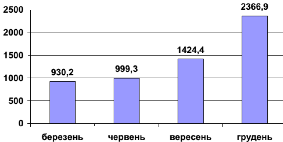
Рис. 2. Заборгованість із виплати заробітної плати в Україні в 2014 році, млн грн

0,56 доларів за годину, в той час як ООН рекомендує встановлювати мінімальну заробітну плату не нижче 3 долари за годину. Катастрофічною в Україні є ситуація з виплати заробітної плати, сума заборгованості якої в 2014 році зросла більш, ніж у 2,5 рази. Так, станом на кінець січня 2014 року заборгованість з виплати заробітної плати становила 753 млн грн.; в подальшому спостерігається стійка тенденція нарощення суми заборгованості, що представлено на рис. 2 [5].