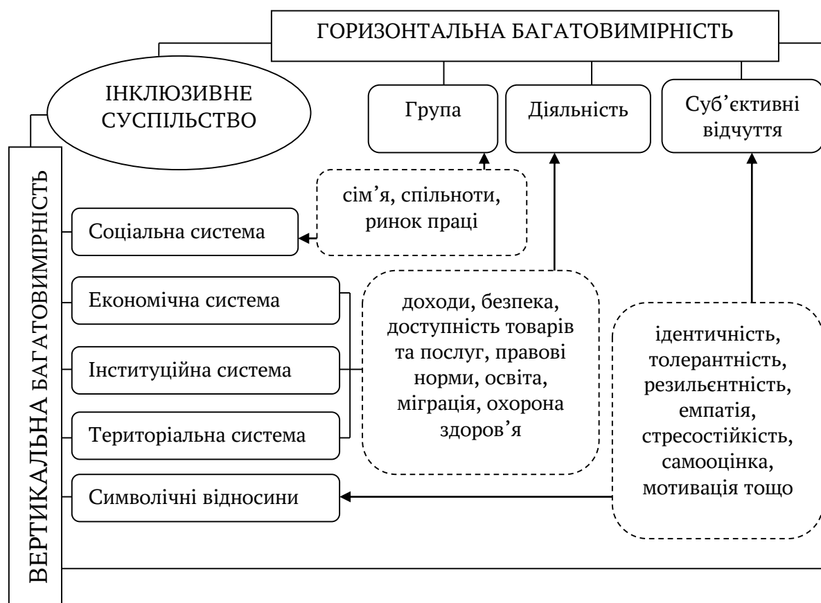
Рис. 1. Модель багатовимірності інклюзивного суспільства

відносини – ідентичність, толерантність, резильєнтність, стресостійкість, самооцінка, мотивація, здатність до емпатії (Farrington, 2012).