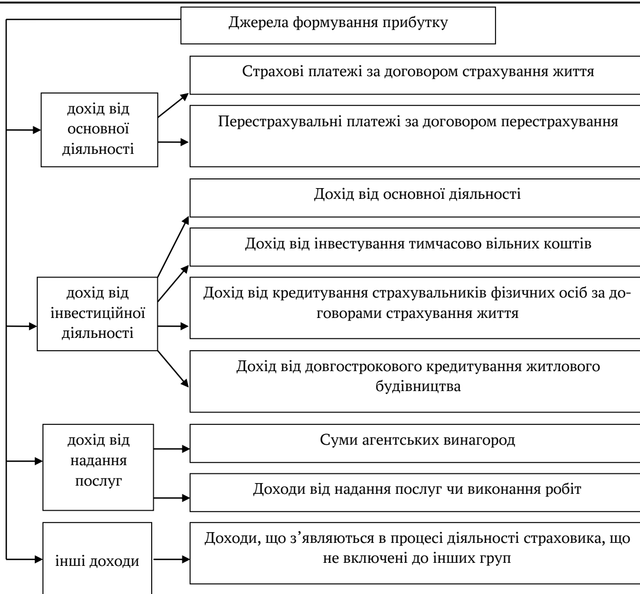
Рис. 1. Схема надходження коштів джерел формування прибутку страхової компанії з страхування життя