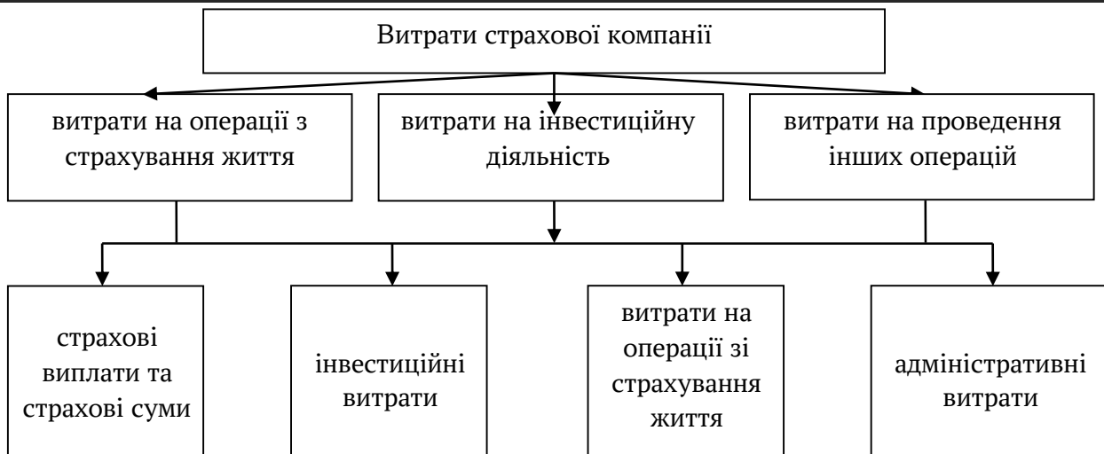
Рис. 2. Джерела формування витрат страхової компанії