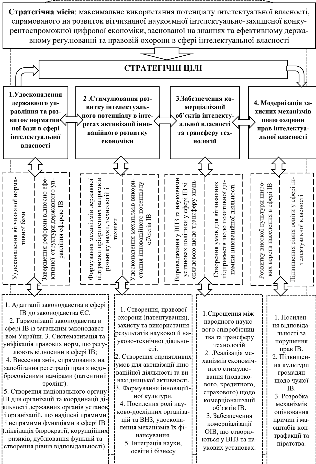
Рис. 2. Основні стратегічні цілі, пріоритетні завдання та механізми активної дії в напрямку науково-технічного розвитку країни в сфері ІВ