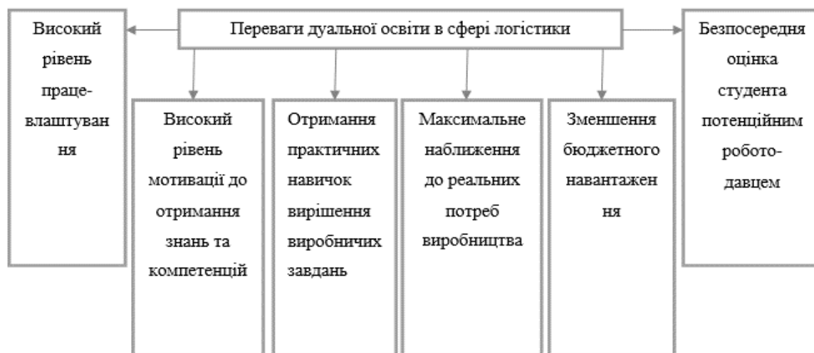
Рис. 1. Переваги дуальної освіти в сфері логістики

дисциплін, які є основою професійної підготовки студента, немає традиційного для класичної форми навчання розриву між теорією і практикою. У студента є чітке розуміння того, що він вивчає і навіщо, як і де ці знання він зможе застосувати в роботі. А це дійсно дуже серйозна мотивація до отримання професійних знань ( Chornopyska, 2008 ).