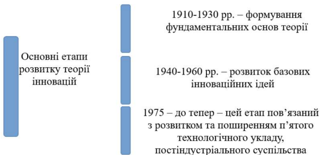
Рис. 1. Основні етапи розвитку теорії інновацій

На сьогоднішній день виділяють три основні етапи розвитку теорії інновацій [6, 9] (рис. 1):