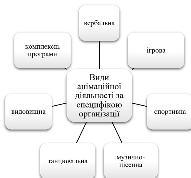
Рис. 1. Види анімаційної діяльності за специфікою організації

До кожного з видів анімаційної діяльності, що поділяються за специфікою організації можна обрати різні види нематеріальної культурної спадщини (рис. 2). Співставлення видів анімацій за специфікою організації та напрямів і видів нематеріальної культурної спадщини доводить, що все ж більшість програм мають бути комплексними аби охопити все багатство та різноманіття культурної спадщини та найбільш ефективно популяризувати етнічний туризм. При цьому різні програми мають бути орієнтовані на широку аудиторію, що вимагає різних підходів та технологій щодо їх організації, відповідного місця проведення забезпечення кадрами та матеріально-технічною базою. Обов'язковим у всьому вище перерахованому є анімаційний менеджмент, тобто управління всім