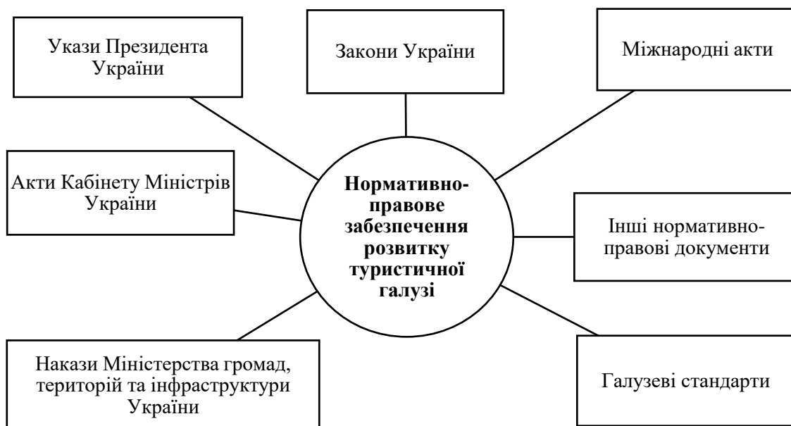
Рис. 1. Нормативно-правове регулювання туризму в Україні

в Україні здійснюється на підставі законів України, наказів Президента України, наказів Міністерства економіки України, Наказів Міністерства громад, територій та інфраструктури України, актів Кабінету Міністрів України, галузевих стандартів, міжнародних та інших нормативно-правових актів, які забезпечують організацію й надання туристичних послуг (Рис. 1).